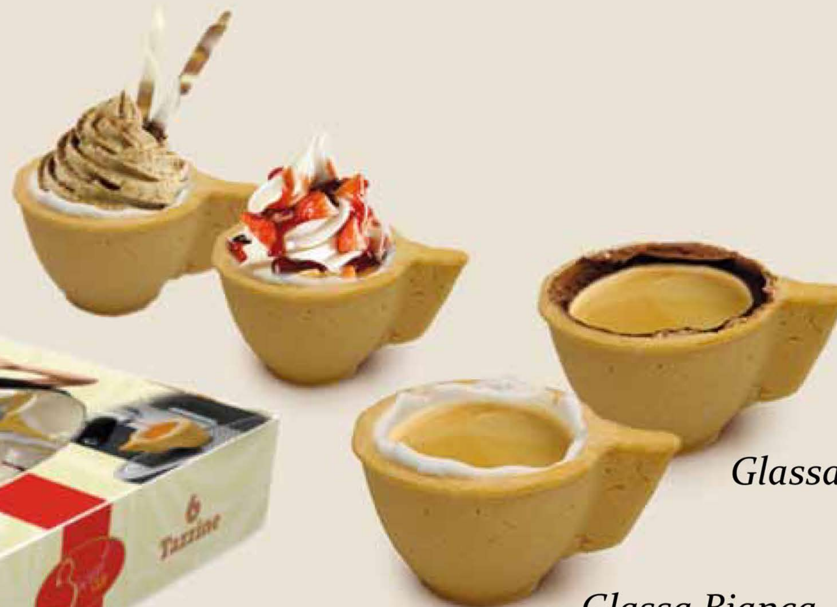
Glassa al Cioccolato